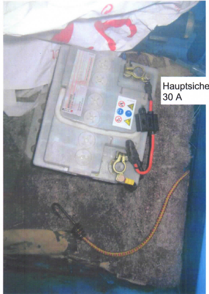
Hauptsicherung 30 A