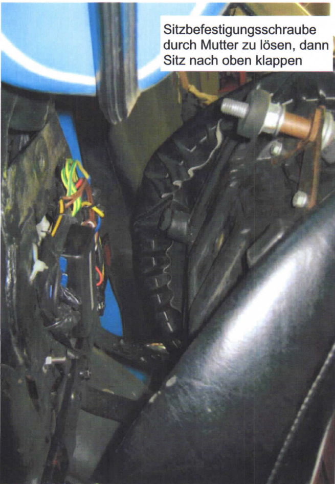
Sitzbefestigungsschraube durch Mutter zu lösen, dann Sitz nach oben klappen